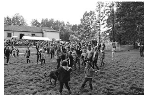
Kartka z Suchedniowa.

Na wszystkich czekały stoiska z lokalnymi potrawami i wypiekami, Rycerze Kolumba grillowali i serwowali przepyszną grochówkę. Można też było obejrzeć pomieszczenie Rycerzy Kolumba, strażacy zapoznawali z wyposażeniem wozu bojowego. Dzieciaki puszczały wspólnie bańki mydlane, rozstrzygnięto też konkurs plastyczny