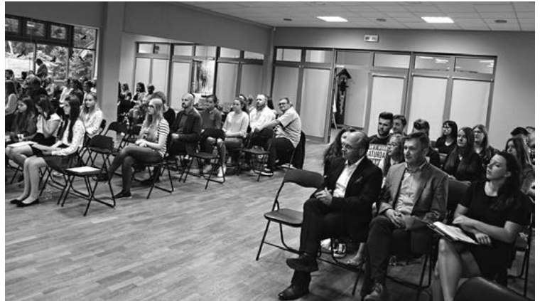
Młodzieżowa Rada Miejska w Suchedniowie

Projekt Od młodzika do młodego polityka realizowany jest w ramach grantu Świętokrzyskie dla młodych przy wsparciu środków pozyskanych z funduszy Urzędu Marszałkowskiego Województwa Świętokrzyskiego.