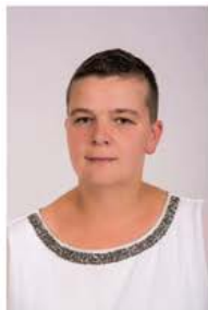
Okręg Wyborczy nr 2 MONIKA BATOR