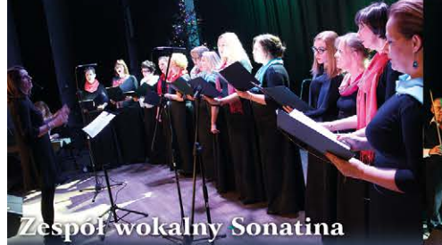
Zespół wokalny Sonatina