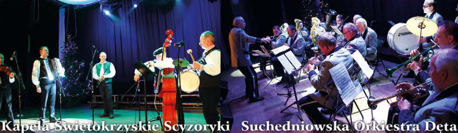
Kapela Świętokrzyskie Scyzoryki Suchedniowska Orkiestra Dęta