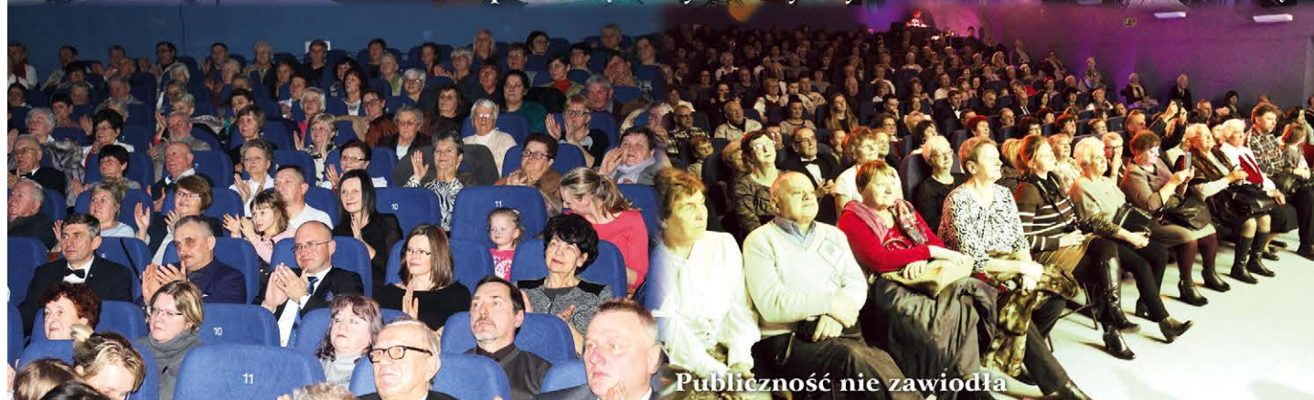
Publiczność nie zawiodła