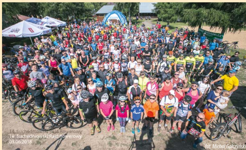
14. Suchedniowski Rajd Rowerowy 19. Suchedniowski Rajd Rowerowy 03.06.2018