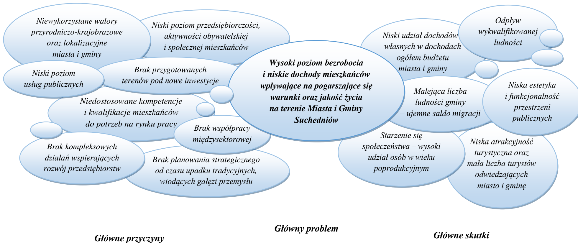
Schemat 1 Drzewo problemów Miasta i Gminy Suchedniów